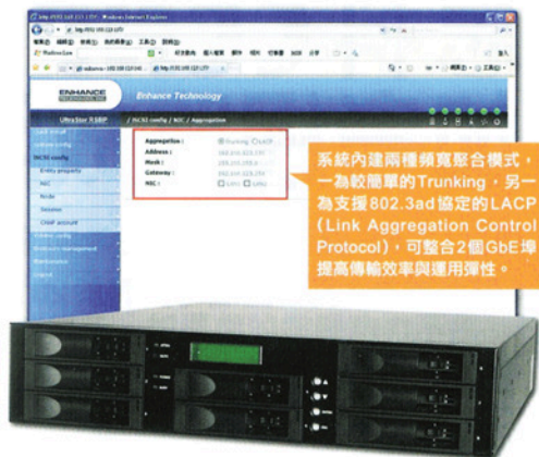
系統內建兩種類寬聚合模式，一為較簡單的 Trunking，另一為支援 802.3ad 協定的 LACP (Link Aggregation Control Protocol)，可整合 2 個 GbE 埠提高傳輸效率與運用彈性。

至於另一款與 RS8 IP 十分相似的 RS8 IP-4，差別則在於擁有更多的 GbE 埠 (4 個)，且採用較高檔的 Intel IOP 342 處理器，還提供額外的磁碟快照服務。